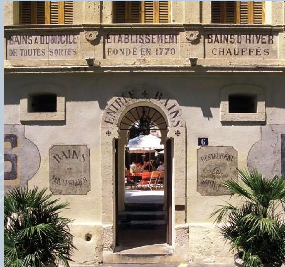
Les bains de Montpellier 6, rue Richelieu